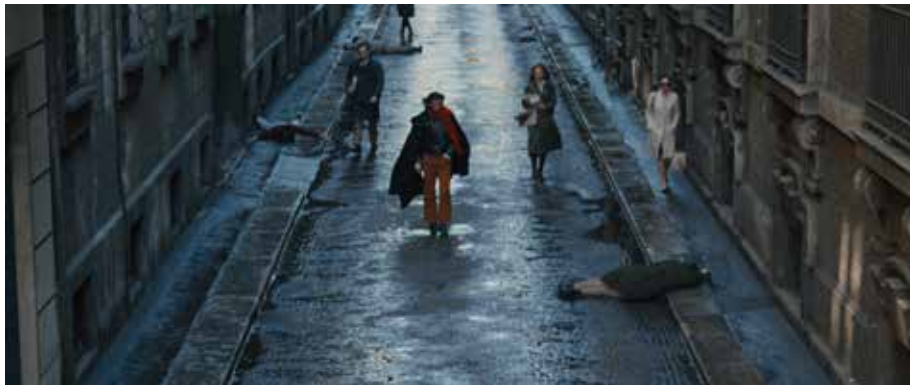
I Cannibali_9_Copyright-1969 Doria Cinematografica - Finanziaria San Marco, SND (Groupe M6), Minerva Productions

I restauri sono stati eseguiti per Locarno Heritage Online da Cinegrell.