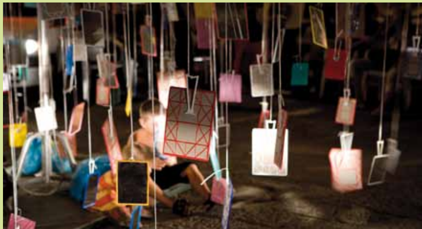
C.i.r.c.u.s., Palermo di Marcello Maloberti, courtesy Galleria Francesco Pantaleone, Palermo

Marianna Vecellio curatore, Castello di Rivoli Museo d'Arte Contemporanea