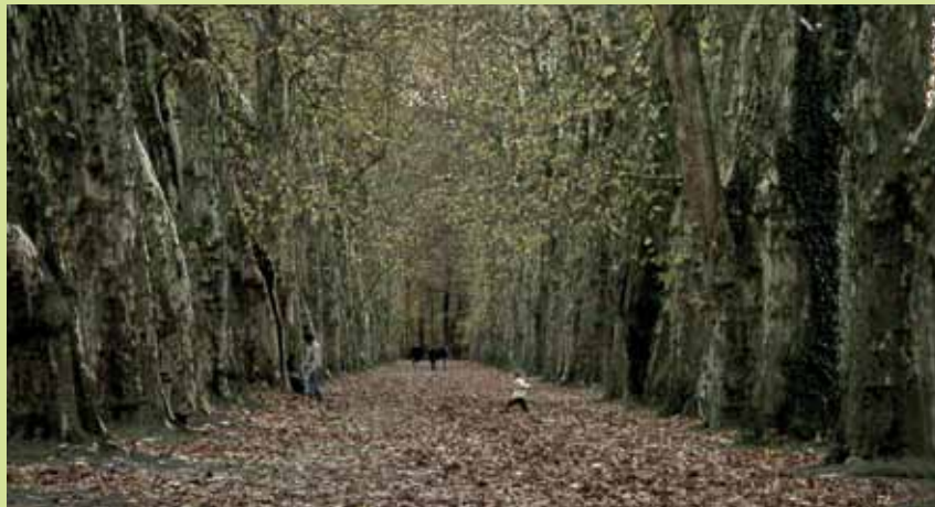
Aussicht di Meris Angioletti, courtesy l'artista