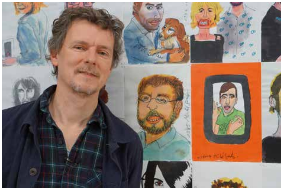
Michel Gondry

Affidandosi a star come Jim Carrey e Kate Winslet, Gael Garcia Bernal e Charlotte Gainsbourg, o sposando un modo di produzione a basso budget, Gondry ha dato al cinema come atto visionario e onirico una nuova dimensione, le sue produzioni uniscono artigianalità e sperimentazione, privilegiando effetti pratici, scenografie costruite e narrazioni sospese tra sogno e realtà, in cui immaginazione e emozione danno forma a universi visivi unici.